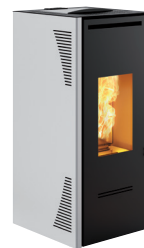
grigio cod. 7241036702I