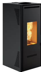
nero cod. 7241036700I

* Il valore riportato di superficie riscaldabile (riferito ad ambienti h. 2,70 m) è puramente indicativo. Data l'infinita possibilità di situazioni che possono verificarsi nelle installazioni, non si garantisce la corrispondenza dei numeri indicati a tutte le applicazioni.