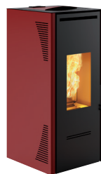
rosso cod. 7241036705I