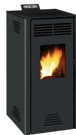
nero cod. 7241036400I

* Il valore riportato di superficie riscaldabile (riferito ad ambienti h. 2,70 m) è puramente indicativo. Data l'infinita possibilità di situazioni che possono verificarsi nelle installazioni, non si garantisce la corrispondenza dei numeri indicati a tutte le applicazioni.