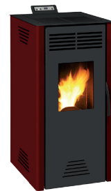
rosso cod. 7241036405I